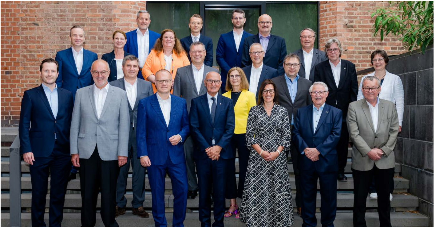
Im Bild, für die Medien, der neugewählte Vorstand der Steuerberaterkammer Nürnberg.